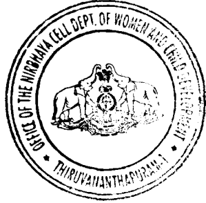
Programme Officer for Women and Child Development Director

Expression of interest is invited from interested and registered NGOs which have expertise in mental health sector in Kerala to run Home for Mental Health under Department of Women & Child Development in Thrissur. NGOs with experience in the fields of women and child care institutions as per JJ Act with psychological approach will be given preference. Copies of registration, audited statements and activity report of previous two years should be submitted along with the proposal. Last date of receipt of EOIs will be 15.10.2020. For details see www.wcd.kerala.gov.in and contact at 0471 2331059.